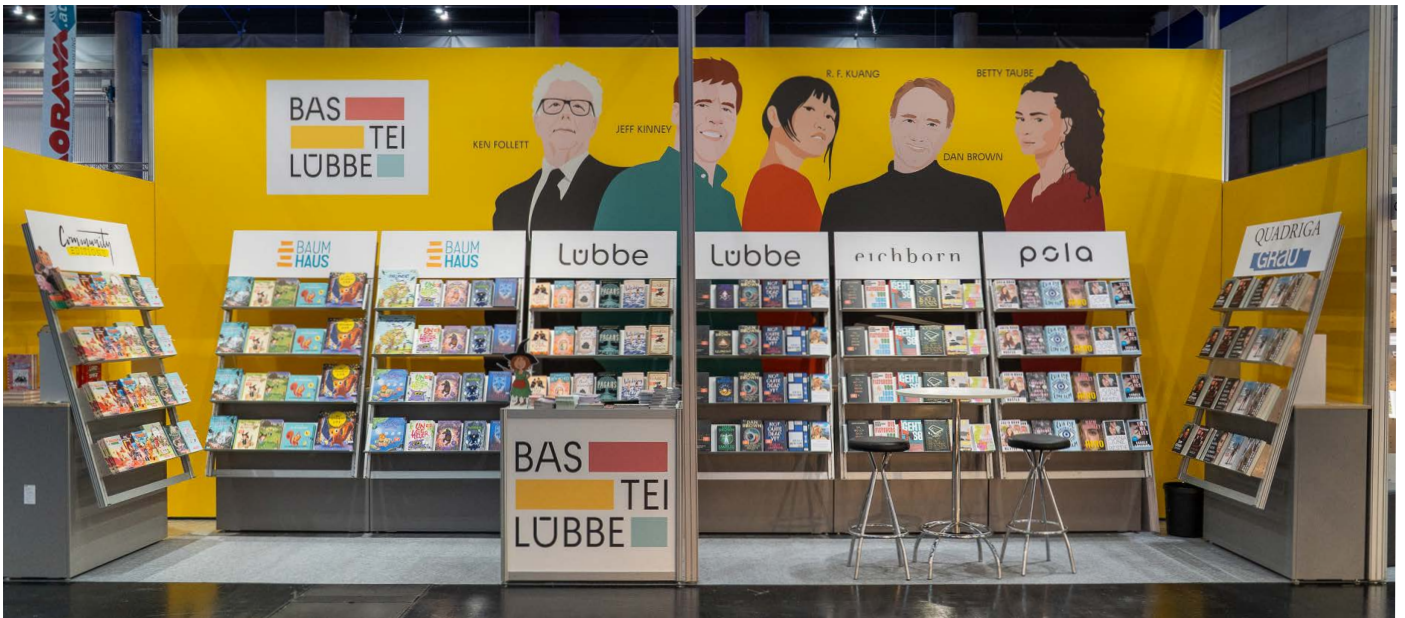
Größe: 16m2, Position: Reihenstand, Ausstattung: Stehtisch „Business“, 2 Barhocker „Standard“, 1 Infopult