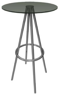
Stehtisch „Veneto“ Ø 60 cm, H: 103 cm Glas € 92,00