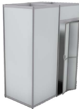
Lager 1 x 2 m mit Falttür 100 x 200 x 250 cm Farbe entspricht Standfarbe