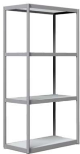
Wandregal (4 Stk. Einlegeplatten) 198 x 99 x 49,5 cm Weiß