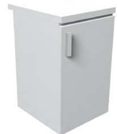
Kühlschrank 85 x 50 x 55 cm Weiß