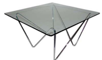
Couchtisch „Milano“ 65 x 65 x 38 cm Glas € 109,00