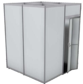
Lager 2 x 2 m mit Falttür 200 x 200 x 250 cm Farbe entspricht Standfarbe