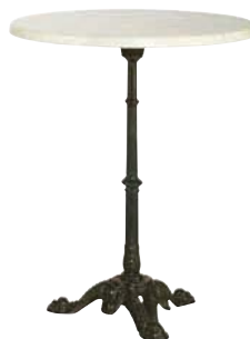
Tisch „Kaffeehaus“ Ø 60 cm, H: 72 cm Weiß € 77,00