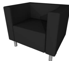
Lederfauteuil „Modena“ 1-er 70 x 78 x 61 cm Anthrazit