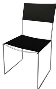
Sessel „Alice“ Schwarz