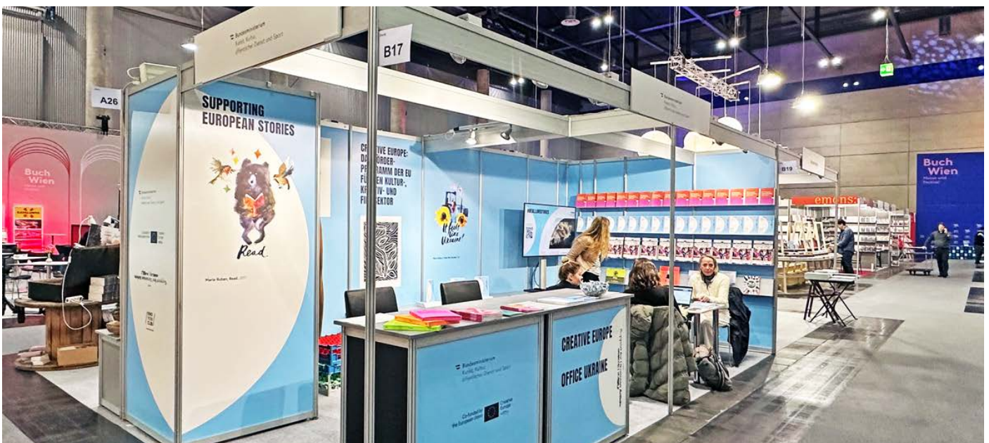
12m 2 Systemstand A mit Grafikwand-Stoffbezug, 2x Infopult, 2x Barhocker „Lifestyle“, 4x Sessel „Alice“, Besprechungstisch Chrom 2 und 1x2 m Lager