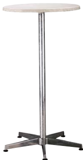
Stehtisch „Business“ Ø 70 cm, H: 110 cm Weiß € 67,00