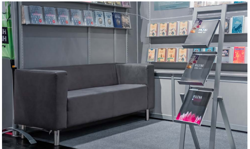
Ledercouch „Modena“ und Prospektständer A4