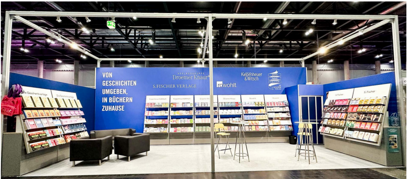
40m 2 Systemstand Plus inkl. 2x Lederfauteuil, 1x Ledercouch, 1x Couchtisch „Milano“, 2x Stehtisch „Veneto“, 1x1 m Lager