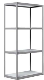
Wandregal (4 Stk. Einlegeplatten) 198 x 99 x 49,5 cm Weiß