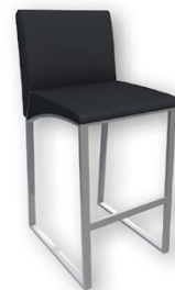
Barhocker „Lifestyle“ H: 70 cm Schwarz