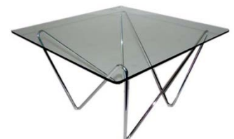
Couchtisch „Milano“ 65 x 65 x 38 cm Glas € 107,00