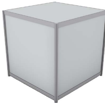
Verkaufspult 99 x 99 x 99 cm Farbe entspricht Standfarbe