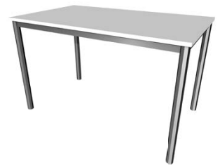
Besprechungstisch „Chrom 2“ 120 x 70 x 72 cm Chrom € 63,00