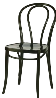
Sessel „Kaffeehaus“ Geflecht