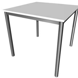
Besprechungstisch „Chrom 1“ 80 x 80 x 72 cm Chrom € 50,00