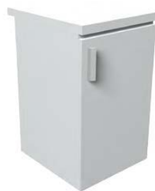
Kühlschrank 85 x 50 x 55 cm Weiß