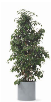
Pflanze H: bis 200 cm