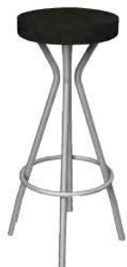
Barhocker „Standard“ H: 80 cm Schwarz