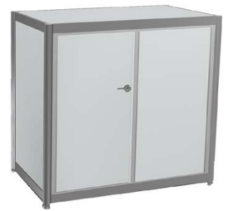
Infopult (mit Türen, versperrbar) 98 x 99 x 49,5 cm Farbe entspricht Standfarbe