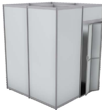
Lager 2 x 2 m mit Falttür 200 x 200 x 250 cm Farbe entspricht Standfarbe