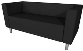
Ledercouch „Modena“ 2-er 126 x 78 x 61 cm Anthrazit € 394,00