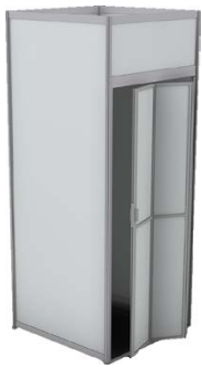
Lager 1 x 1 m mit Falttür 100 x 100 x 250 cm Farbe entspricht Standfarbe