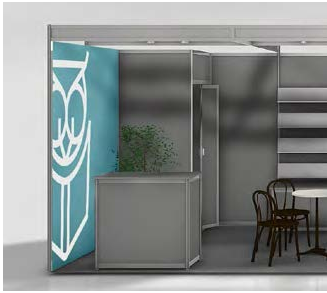
Grafikwand Stoffbezug + Druck 95 x 238 cm (sichtbarer Bereich)