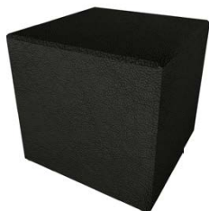
Hocker „Napoli“ 45 x 45 x 45 cm Schwarz